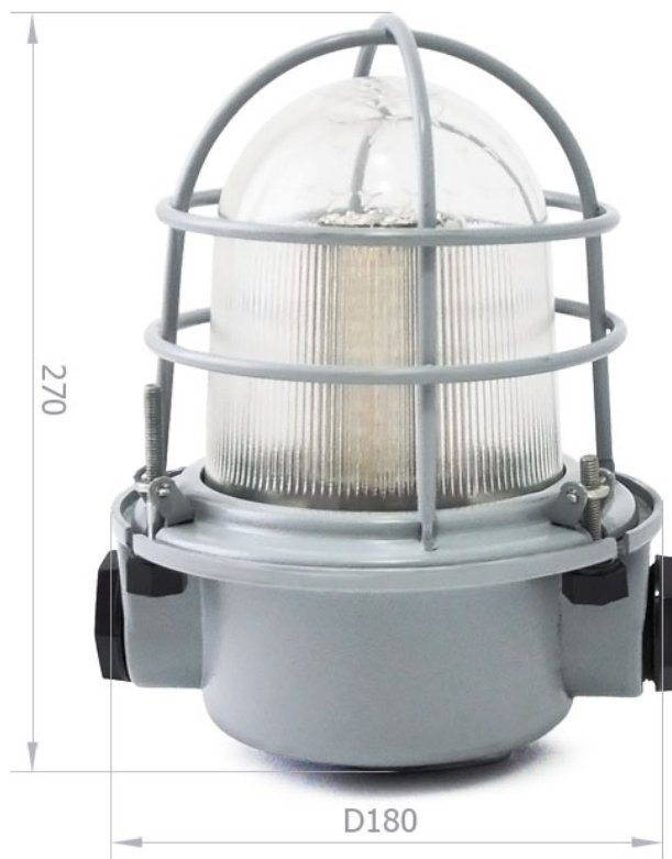
Рисунок 1 – Внешний вид светильника.

Внешний вид и габаритные размеры светильника представлены на рисунке 1.